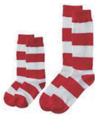
スマイルソックス

ドリンクとドナルドとおそろいの赤白シマシマのスマイルソックスが貰えます。みんなでスマイルソックスをはいて、病気のお子さんとそのご家族にエールを送りましょう!