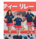
武蔵野大学 フラッグバトン部