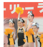
Jubilly Dance Crew