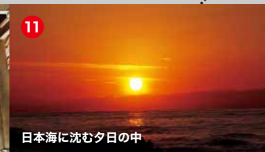
日本海に沈む夕日の中