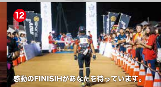
感動のFINISHがあなたを待っています。