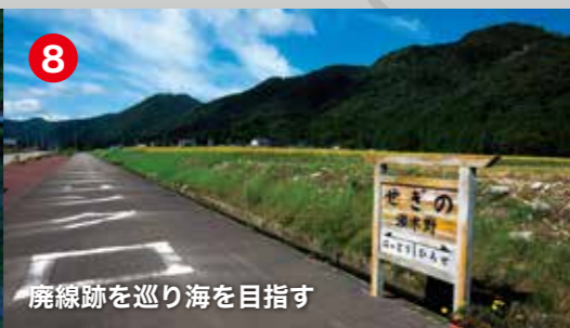
廃線跡を巡り海を目指す