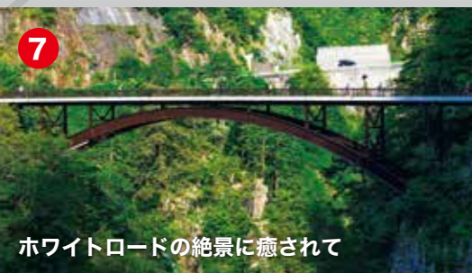
ホワイトロードの絶景に癒されて