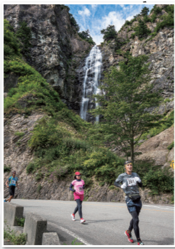
2 白山白川乡白色之路瀑布观光