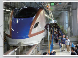
12 西日本铁路白山综合车辆所