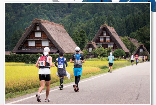
1 世界遗产白川乡的合掌建筑