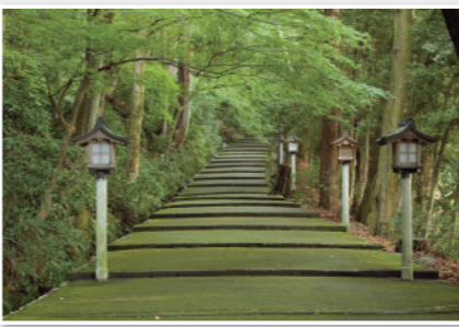
7 白山比咩神社正门通道