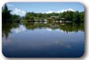
美女ヶ池(美女高原)

Finish 国府B&G体育館 16:00(72kmの部) 19:00(100kmの部)