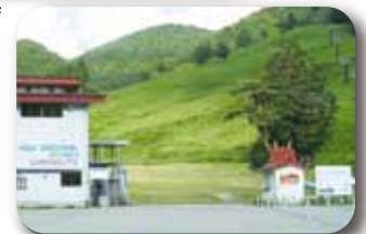
飛騨高山スキー場・キャンプ場