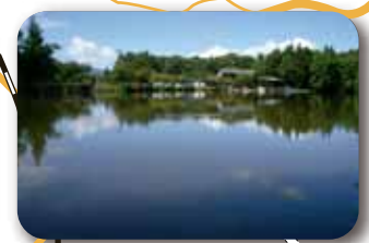
美女ヶ池(美女高原)