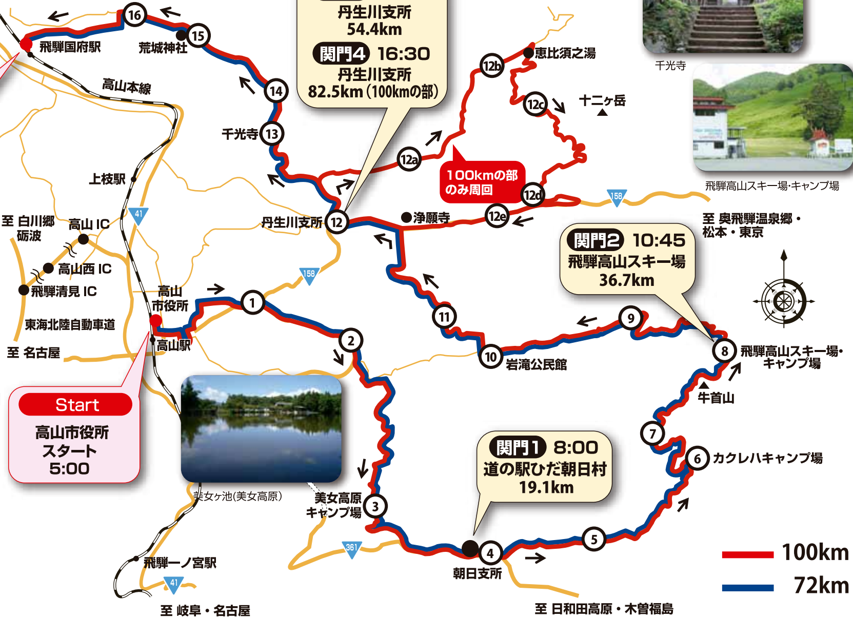
美女高原 キャンプ場