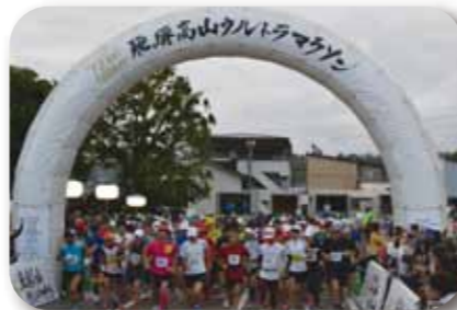
市役所をスタート

Finish 国府B&G体育館(予定) ①100km第1フィニッシュ 18:45 ②100km第2フィニッシュ 19:00 ③72km 第3フィニッシュ 16:15