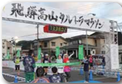
国府町内フィニッシュ

Finish 国府B&G体育館(予定) ①100km第1フィニッシュ 18:45 ②100km第2フィニッシュ 19:00 ③72km 第3フィニッシュ 16:15