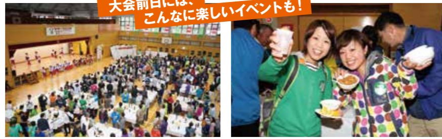
大会前日には、こんなに楽しいイベントも!

高原野菜のサラダやパスタを食べながら、ランナー同士の情報交換をしましょう! ウルトラ参加者もショート参加者もふるってご参加ください。 申込方法は大会3週間前に送付する参加案内でお伝えします。