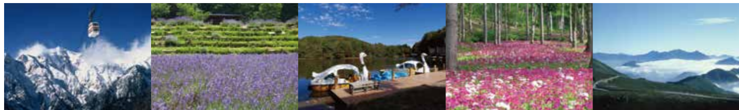
新穂高ロープウェイ